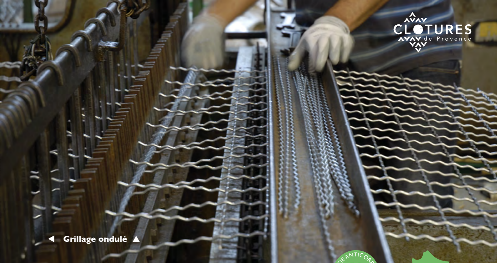
◀ Grillage ondulé ▶